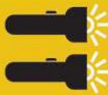
Linternas de dinamo