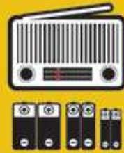
Radio con pilas