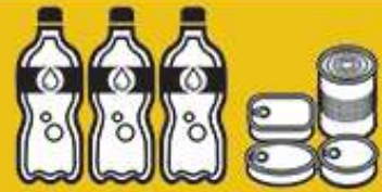
Agua embotellada y comida no perecedera