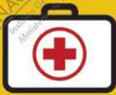
Botiquín primeros auxilios